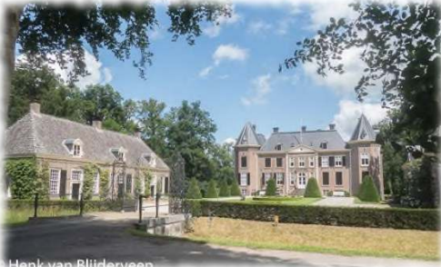
Henk van Blijderveen

ijkselder. Het landgoed wordt samen met landgoed Westerflier (6) als een geheel beheerd door een rentmeesterskantoor.